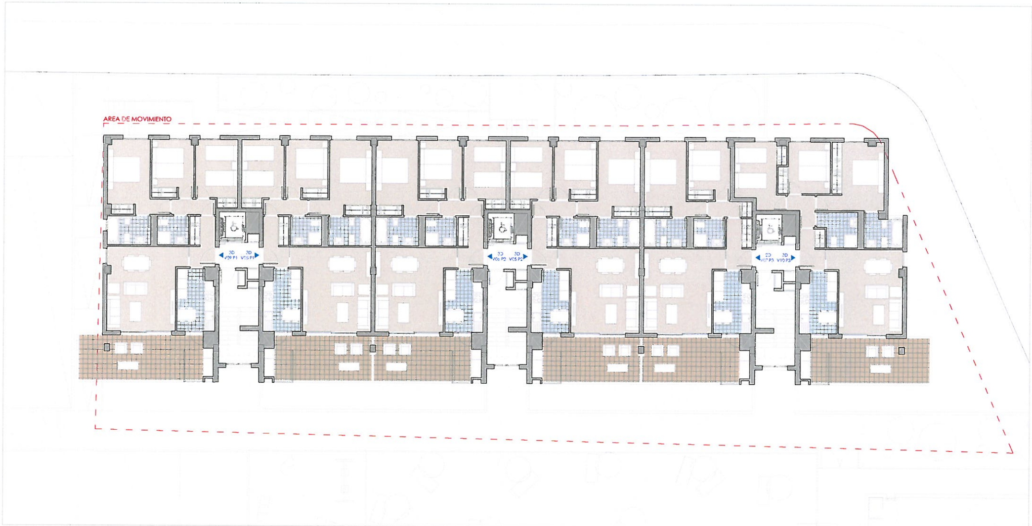
PLANTA TIPO 2º a 5º