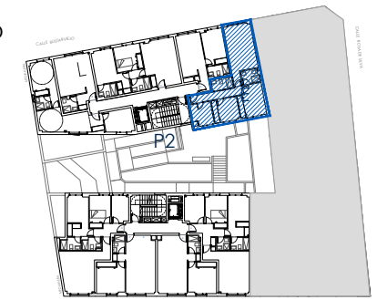
PLANTA 2ª C/ I. MERCEDES