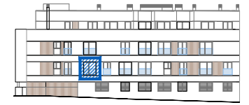
ALZADO C/ BUSTARVIEJO